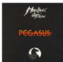
"Montrenx" Ref:802014 Serie: 02 Cod:8425845002682