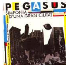
"Simfonia d'una gran..." Ref:802011 Serie: 02 Cod:8425845002712