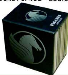
"Integral" 9 discos Ref:910714 Serie: 25 Cod:8425845907550