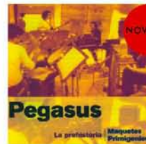
"Maquetes Primigènies" Ref:910747 Serie: 02 Cod:8425845907871