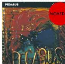
"Coctel" Ref:910708 Serie: 02 Cod:8425845907499