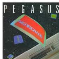
"Searching" Ref:802013 Serie: 02 Cod:8425845002699