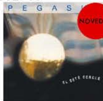
"El setè cercle" Ref:910707 Serie: 02 Cod:8425845907482