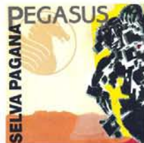
"Selva Pagana" Ref:902017 Serie: 02 Cod:8425845003108