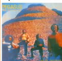
"Nuevos encuentros" Ref:802010 Serie: 02 Cod:8425845002729